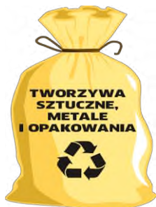
WORKI ZAPEWNIĄ ZM NATURA