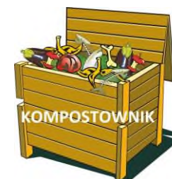
KOMPOSTOWNIK ZAPEWNIĄ WŁAŚCICIEL