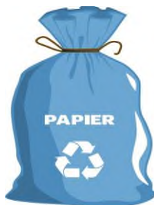
WORKI ZAPEWNIĄ ZM NATURA