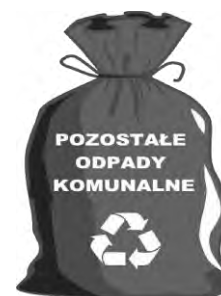
WORKI LUB POJEMNIK ZAPEWNIĄ WŁAŚCICIEL