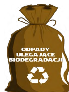
WORKI ZAPEWNIĄ ZM NATURA