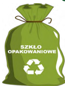
WORKI ZAPEWNIĄ ZM NATURA